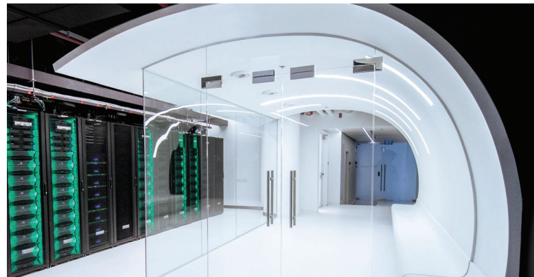
Le laboratoire QA à Herzliya