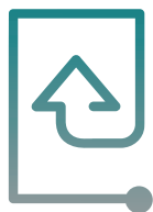
InfiniBox SSA ™